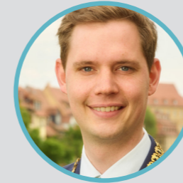
Jonas Glüsenkamp 2. Bürgermeister der Stadt Bamberg, GRIBS-Vorstand