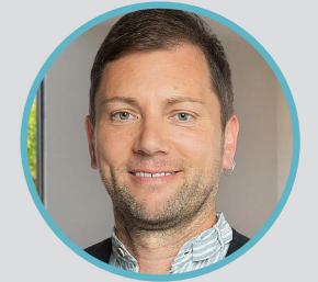
Andreas Birzele, MdL Sprecher für Kommunales der Landtagsfraktion